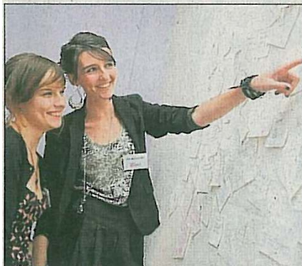
Les étudiants étaient invités à inscrire leur rêve sur le mur des rêves.